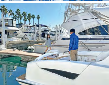
リビエラ逗子マリーナはゲスト パークを完備しており、レストラン にはボートでのアクセスが可能。 (要事前予約)