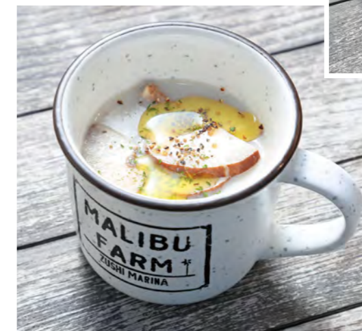
茸のクリームスープ

一般的なルッコラよりも強く香る胡麻のような風味が特徴的なセルパチコとカリフォルニア産のブラータチーズ、季節のフルーツを合わせ、オリジナルのバルサミコドレッシングで味わうマリブファームのシグネチャーサラダ。