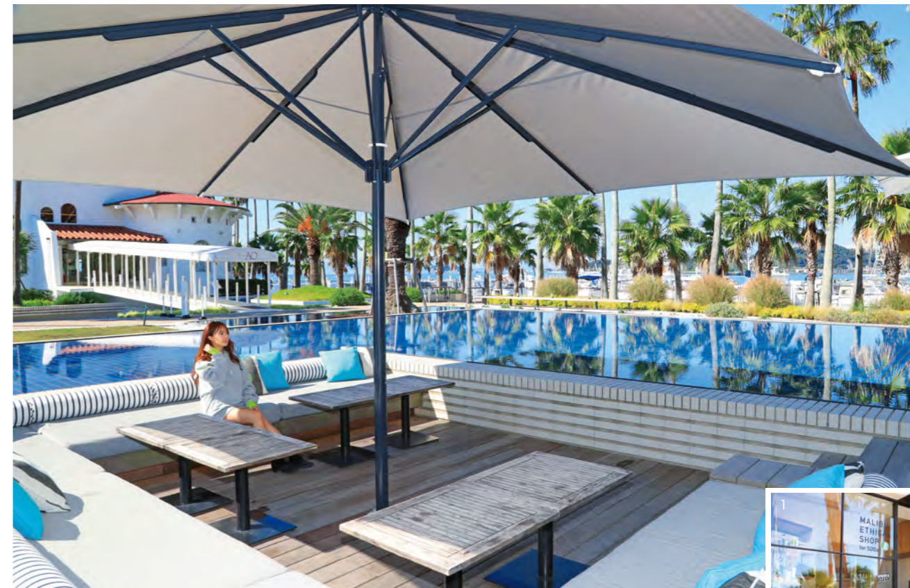
マリーナから見える海と繋がるような大きな水盤が広がる約80席のテラスエリアには三方を 水に包まれたウォーターテラス席など、趣向を凝らした様々な席が用意されている。

取材協力 | マリブファーム 逗子マリーナ 〒249-0008 神奈川県逗子市小坪5-23-16 リビエラ逗子マリーナ内 TEL:0467-23-0087