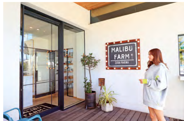
“FRESH, ORGANIC, LOCAL”をコンセプトに地元食材や厳選された サステナブルな食材を使った、体にも地球にも優しい料理を提供している。