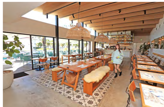
店内は全開放可能なサッシによって、テラスとの 一体感を感じられる開放的な空間となっている。