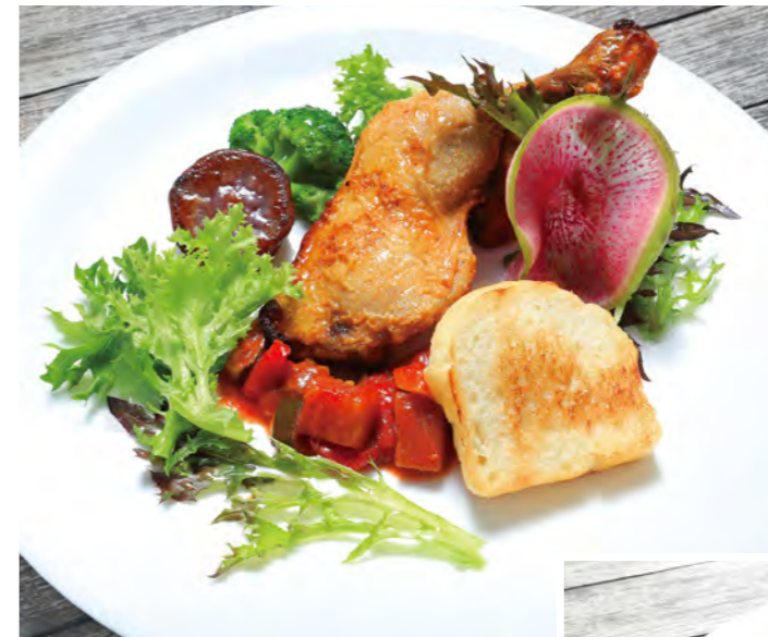
骨付き鶏腿コンフィとラタトゥウ

低温で2時間、しっかりと焼き上げた鶏腿肉に、ビタミンやミネラル、クエン酸が豊富なラタトゥウを合わせた相性抜群な一皿。地球に優しい農法で育てられた循環野菜も添えられている。