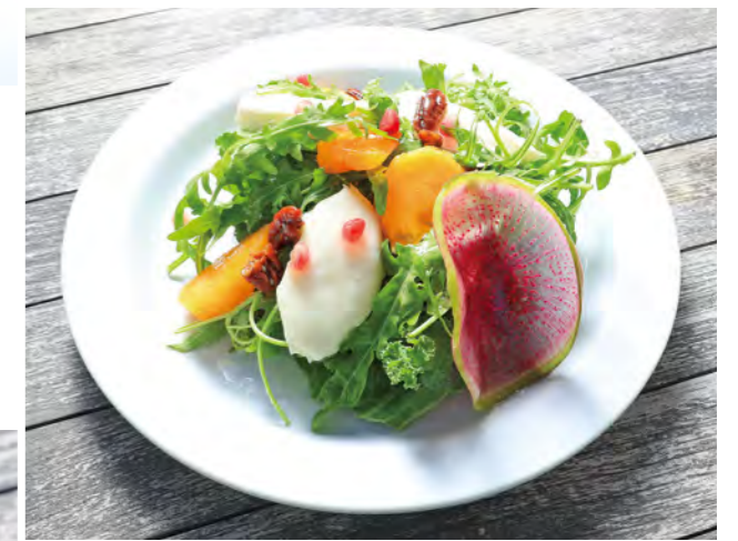
ブラータチーズとセルパチコ、フレッシュフルーツのサラダ バルサミコドレッシング

洗練された空間で非日常の雰囲気を感じながら食事を楽しめる。3か月に1度リニューアルされるメニューは食べ合わせの効能までもが考え抜かれた逸品揃い。