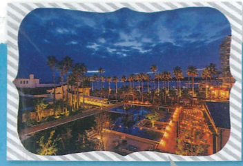
ライトアップされた 夜も幻想的。絶景を前に ゆっくりお酒を