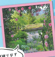
季節が織りなすイギリス式庭園