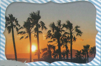
時間によって いろいろな表情を見る。 サンセットは必見