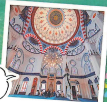
トルコ気分な美しきモスク