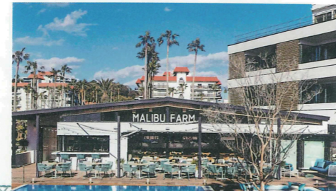
水盤に囲まれた開放的な ウォーターテラス席。 早めの予約を