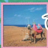
ラクダにゆられてまるでサハラ砂漠