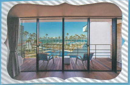
マリブホテルの バルコニーからも西海岸のよ うな絶景を見渡せる