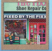
アメリカンな街並み