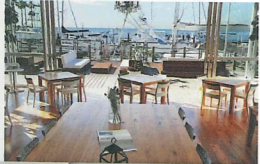
Ron Herman cafe Los Angeles CA