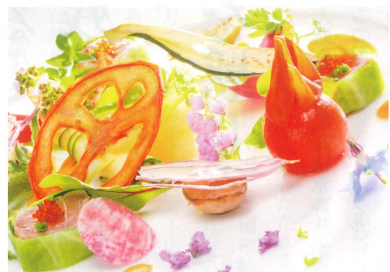
地元産の有機野菜を使用したフランス料理のディナーを

公園や浜辺で、ヨガを楽しむ光景を目にする機会が増えてきました。清々しい朝日を浴びながら、ゆったりとポーズをとる姿はとても優雅。「いつか私も」と、気持ちひき付けられます。 ご案内するのは、マリーナリゾート・神奈川県逗子や高原リゾート・福島県裏磐梯の自然に抱かれながら、人気のヨガを体験する旅。はじめての方も体が硬い方も、気軽にご参加ください。 自分のペースで 心と体が喜ぶヨガ体験 「健康のためにも体を動かしたけれど、エクササイズなんてとてもとても」……ヨガは、そんな皆さまにおすすめしたいリフレッシブ＆ストレス解消法です。 健康維持の面でも、姿勢・肩こり・腰痛の改善、筋力・持久力やバランス能力の低下予防などが期待され、近年の研究ではヨガの瞑想により脳が休まり認知症の予防