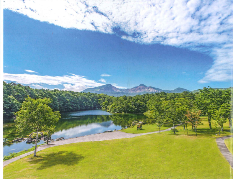
裏磐梯の景色を望みながら、自分のペースでヨガ体験