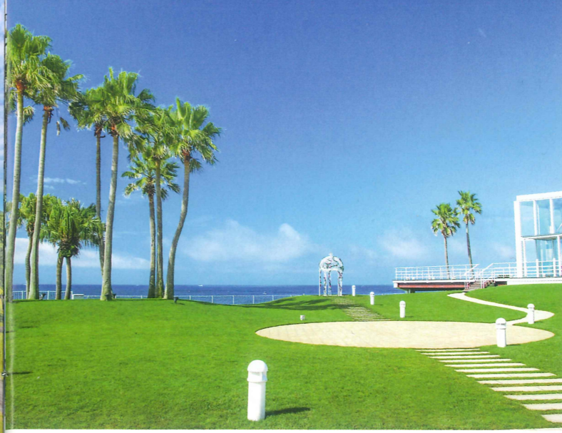
リゾート気分いっぱいの「リビエラ逗子マリーナ」で、 気軽な日帰りヨガ体験