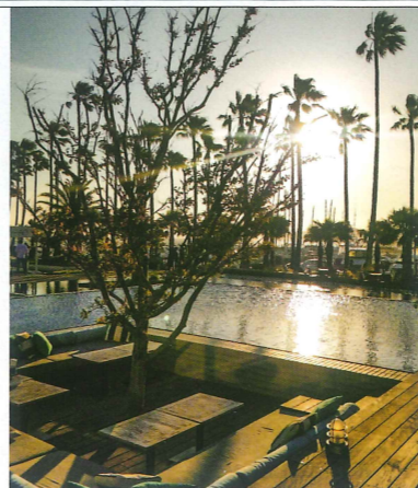
マリブホテルから夕日を望むひと時

これは、地中海クルーズ?あの海岸は、コートダジュール?決して大げさではなく、そんなふうに感じてしまうほどのまぶしい風景が広がります。リビエラ逗子マリーナから大型のヨットに乗り、五月の爽やかな風を感じながらのクルージング。「日本じゃないみた