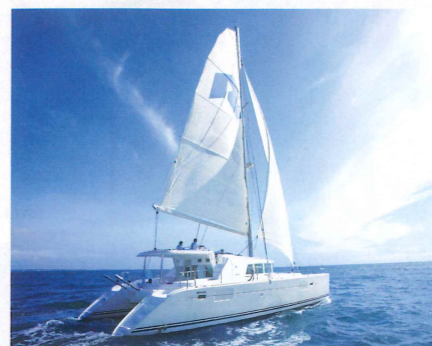
広々とした「カタマランヨット」で快適なクルージング

が、船上から見るとまったく違う場所に見えます。「南仏リゾートに似ている」と聞いていたのですが、さまざまな海外ツアーに添乗してきた私も、そのとおりだと驚きました。お客さまには、ヨットの舵を握っていただく特別なひと時も、「船の操縦に憧れていたけれど、今日、それが叶うなんて!」と、