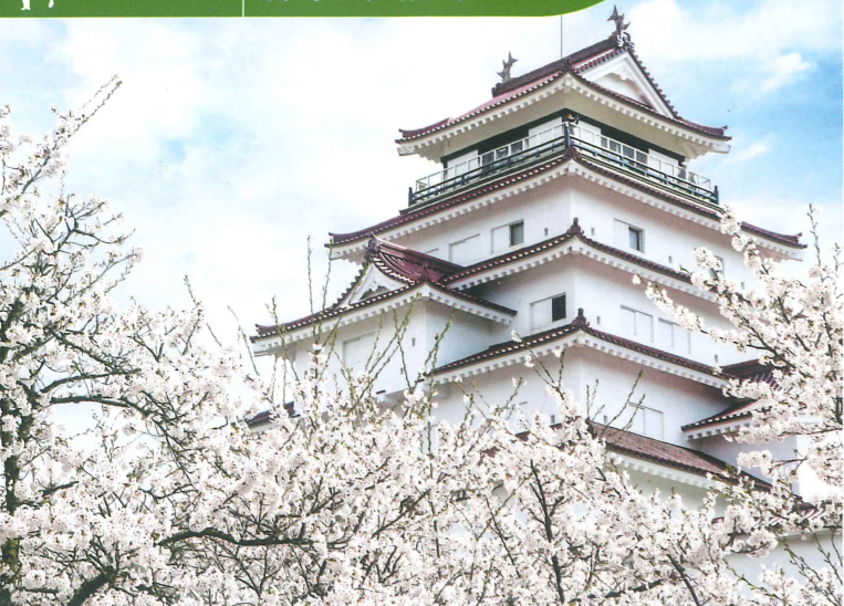
満開の桜も美しい鶴ヶ城公園を散策するひと時も