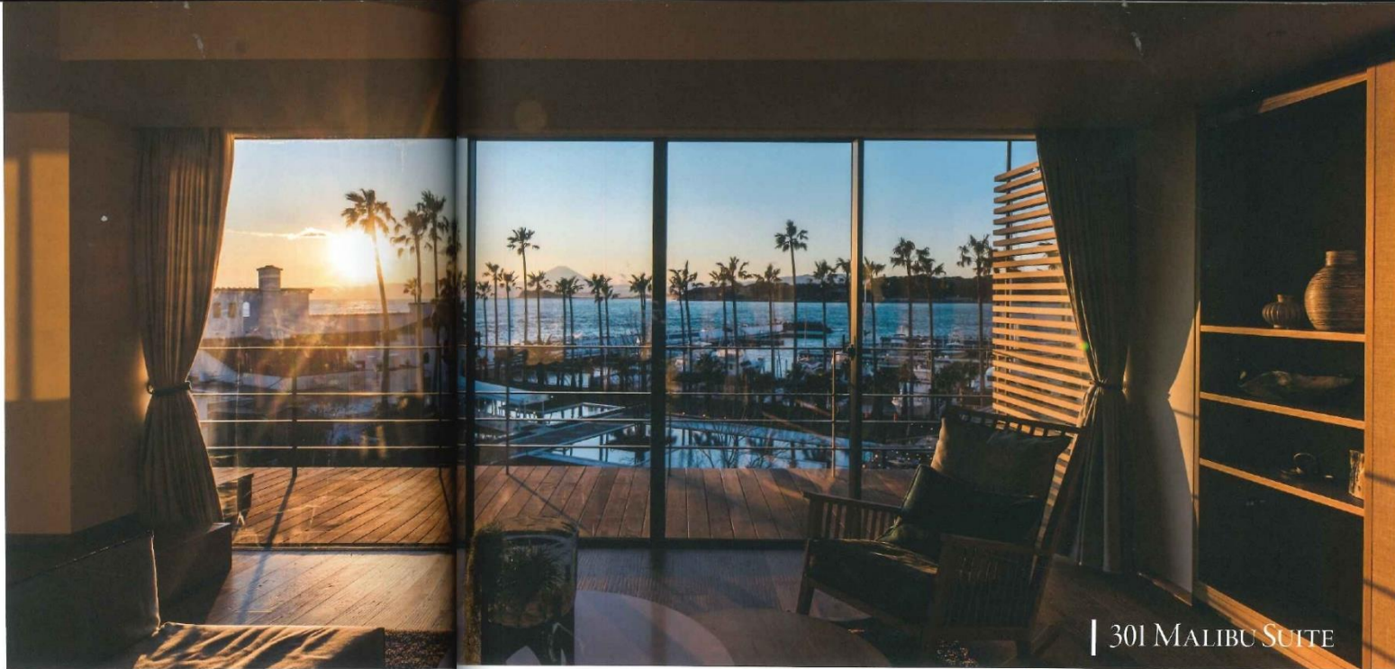
301 MALIBU SUITE

季節や自然条件など、その瞬間に合わせて提案する「プライベートセッティング」は、MALIBU HOTELの特別なおもてなし。リビエラ返子マリーナの広大な敷地の中で眺めの良い場所にテーブルをセットし、食事を楽しむことができる。他には、カタマランヨットのセーリングが楽しめる「プライベートクルージング」や「プライベートテニス」、「プライベートヨガ」、「サイクリング」