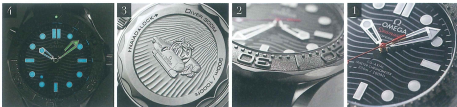
1:ダイヤルはセラミック製。その表面には波模様を彫り込み、ポリッシュ&サテンで仕上げることで、立体的な波を演出する 2:通常モデルのベゼルはセラミック製だが、パートナーシップモデルのベゼルは、マット仕上げのチタン素材を採用。ドットや数字まできれいに仕上げられており完成度が高い 3:ケースバックには、ネクトンが所有している潜水艇が彫り込まれる。この潜水艇は水深3000mまで潜って、サンプルなどを採取してくるのだ 4:暗い深海でもきちんと時刻を確認できるように、インデックスと針に夜光塗料を塗布している