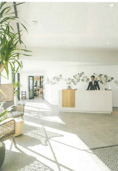
リゾート感あふれるレセプ ション。“MALIBU FARM”に ダイレクトアクセスできる

朝食の後は 絶景の湘南クルーズを体験 湘南の海を満喫できるアクテ イビティは、マリブホテルなら ではのラグジュアリーな体験。 ゆつくりと朝食を楽しんだ後 は、ホテルから徒歩すぐのヨッ トハーバーから出航するクルー ジングをぜひ体験してほしい。 約2時間のプライベートクル ーズやショートクルーズなど、 時間や予算に合わせてチョイス できる。見渡す限り美しい海 や、遠く江ノ島や葉山の風景を 望むクルージングは、非日常的 な体験になること請け合い。 ほかにもプライベートヨガや サイクリングなどのアクティビ ティが用意されており、1泊の 滞在でもったいないほど。80 0本の椰子並木に囲まれた、9 棟のリゾートマンションを有す るリビエラ逗子マリナー内には