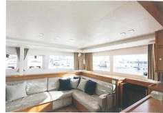
カタマランヨットの船内はホテル の客室のような豪華さ

40分ほどの乗り合いクルージング6600円から、フルー ツの盛合せとシャンパンが付いた豪華なフランス製カタ マランヨットをチャーターできるプライベートクルーズ 30万円など、多彩なプランが用意されている。